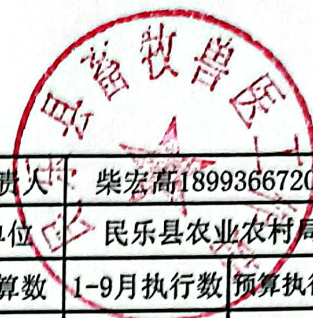
绩效目标运行监控表 (2023年)